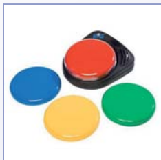
Sprechschalter: BigMack, Step by Step